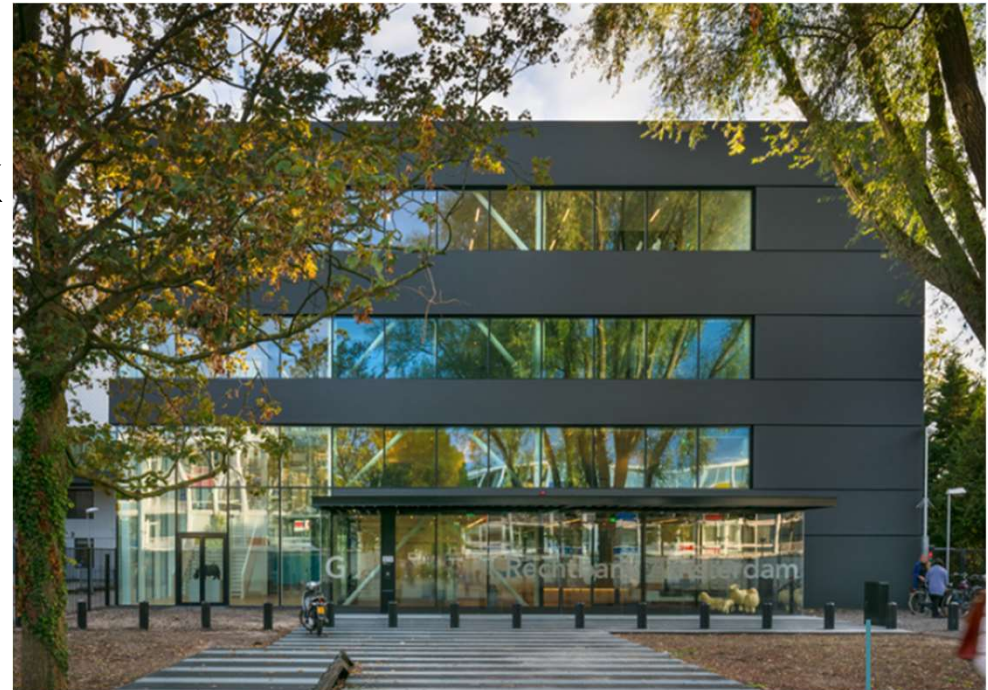
Tijdelijke rechtbank Amsterdam, Lagemaat