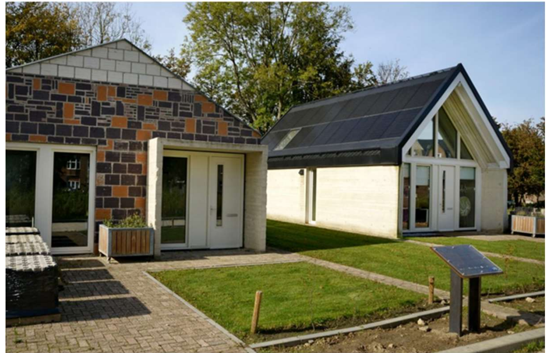
Project Superlocal, Dusseldorp